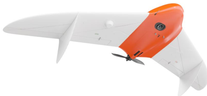
Рисунок 1. БАС «Геоскан 201»

Комплекс для аэрофотосъёмки со временем полёта до 3 часов. Геоскан 201 Геодезия позволяет снимать до 80 кв. км в день и получать ортофотопланы с точностью геопривязки, соответствующей требованиям масштаба 1:500. А благодаря геодезическому GNSS-приёмнику на борту можно получить точные координаты привязки снимков и повысить качество обработки данных.